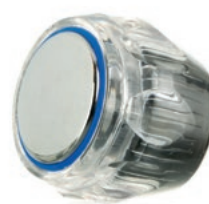
Pokrętko P wieloklin 20 Art. HDP20