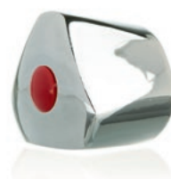
Pokrętko SD02 wieloklin 24 Art. HDSD0224