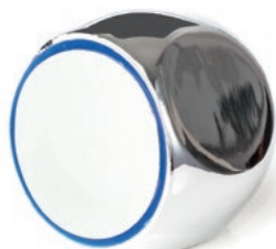
Pokrętko C wieloklin 20 Art. HDC20