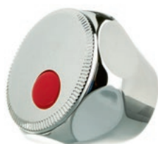
Pokrętko A wieloklin 20 Art. HDA20