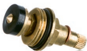
Głowica do baterii wieloklin 24 Art. CCSD12