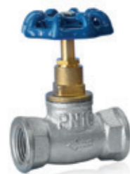
Zawór przelotowy żeliwny