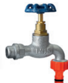
Zawór czerpalny żeliwny

Malleable cast iron bibcock valve with hose connector