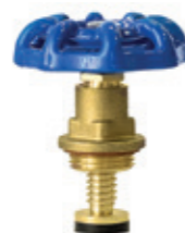
Głowica mosiężna do zaworu żeliwnego

Brass head for malleable cast iron globe valve