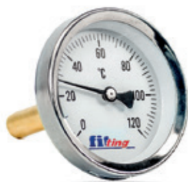
Termometr bimetaliczny axialny

Bimetal thermometer with axial connection