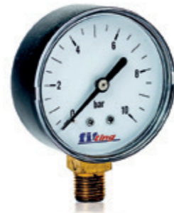
Manometr radialny 0-10 bar

Pressure gauge with radial connection 0-10 bar