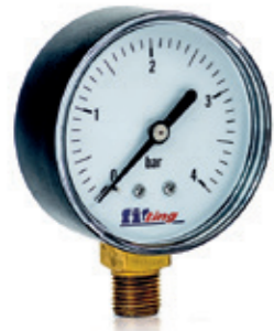
Manometr radialny 0-4 bar

Pressure gauge with radial connection 0-4 bar