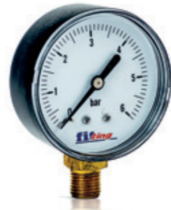
Manometr radialny 0-6 bar

Pressure gauge with radial connection 0-6 bar