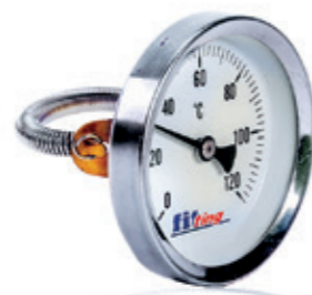
Termometr bimetaliczny przylgowy